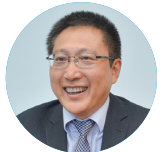
曾 形 総経理

る600社以上のお客様をパートナーとして紹介することも可能です。新ビジネスを検討しているお客様にはぜひお声がけいただき、一緒にチャレンジしていきたいです。